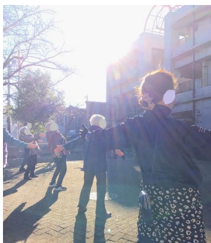
毎週木曜日 9:15～ 膝折市民センター広場(膝折町)