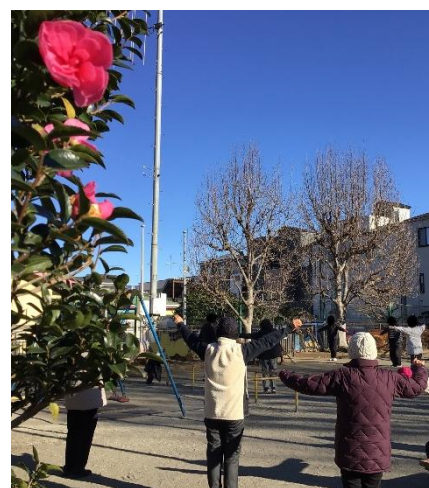
毎週金曜日 9:15～ 越戸公園(栄町)