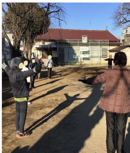
毎週火曜日 9:00～ 緑ヶ丘児童遊園地(幸町)