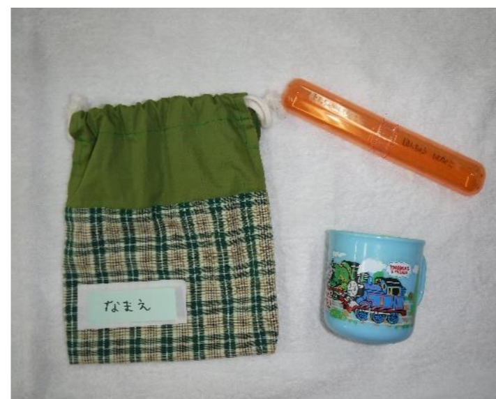
【歯ブラシケース・コップ・コップ袋】