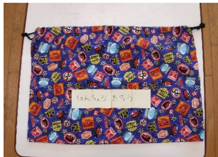
【シーツ持ち帰り用袋】