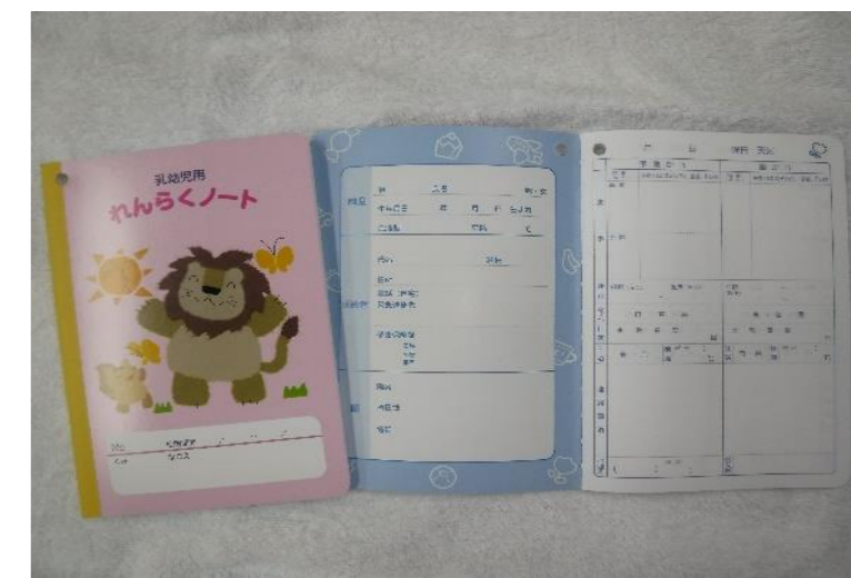
【乳児連絡帳(1, 2歳)】保育園で販売

■髪の毛の長いお子さんは、ゴム等（輪ゴムは切れやすい）で結うよう、また飾りの付いたゴムやピンは接触等で危険なこともありますので避けてください。